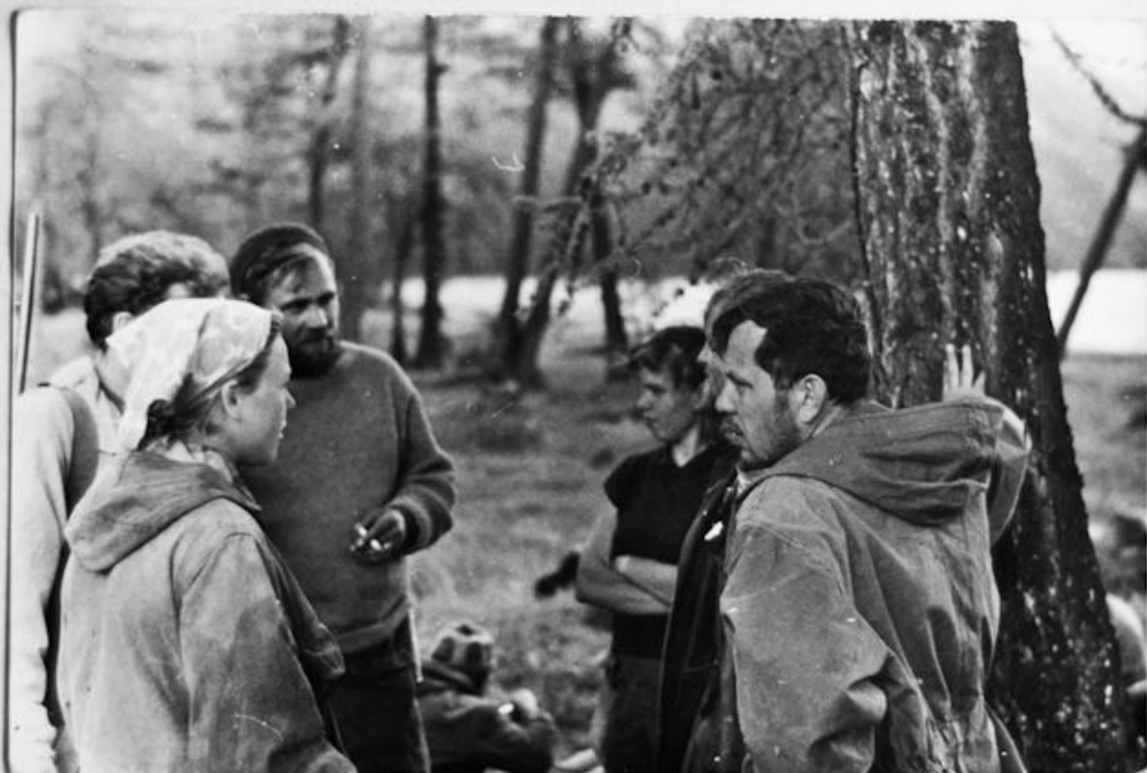
оз. Карахоль. Встреча с геологами

Условия передвижения, сложные участки маршрута, способы и средства преодоления естественных препятствий, обеспечение безопасности, жизнь и быт в походе.