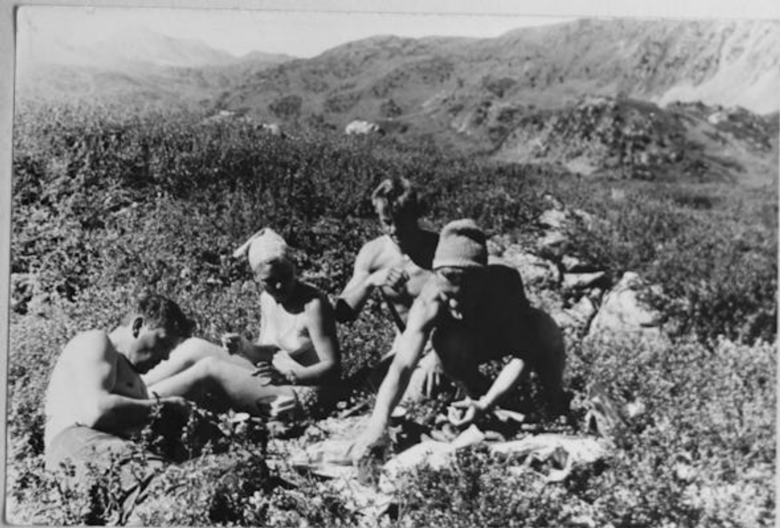
У ОЗЕРА h = 2000 м

Смета расходов, списки снаряжения, продукты питания, литература, приложения, выводы.