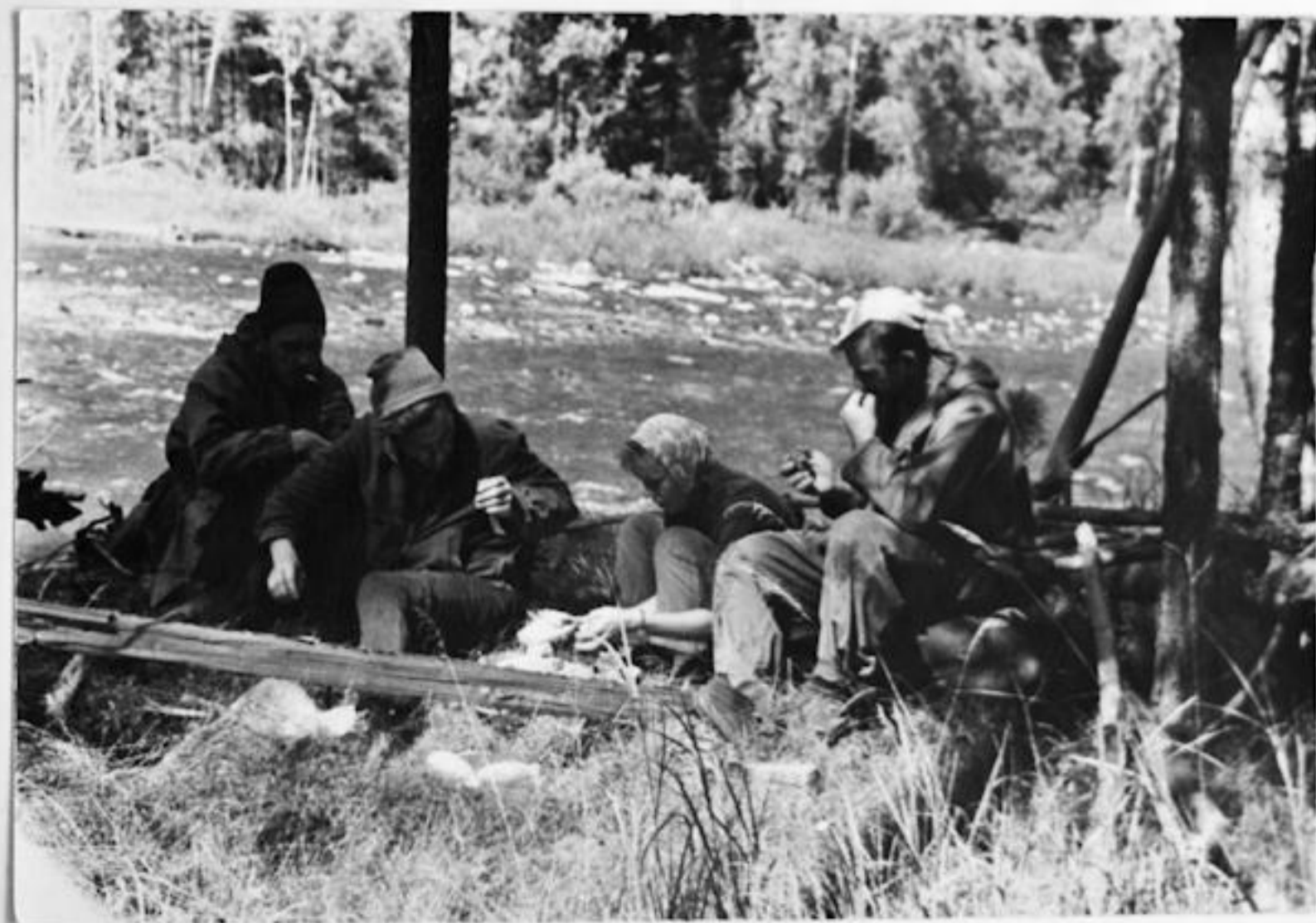
р Она ХОЛОДНЫЙ ДБЕД