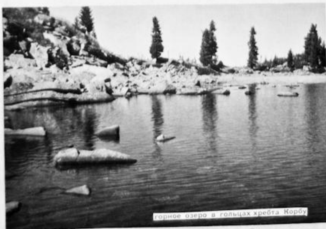
горное озеро в гольцах хребта Корбу

Цели, время проведения, район, маршрут, способы передвижения, вид туризма, категории сложности, состав группы, протяжённость и продолжительность путешествия.