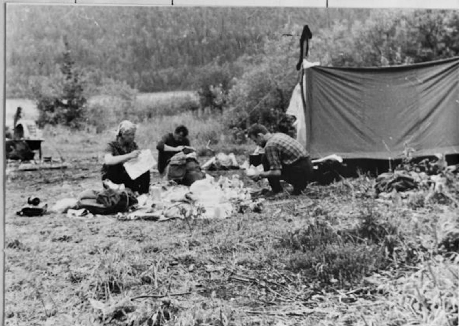
ОКОЛО Т/Б ОЗ. ТЕЛЕЦКОЕ "