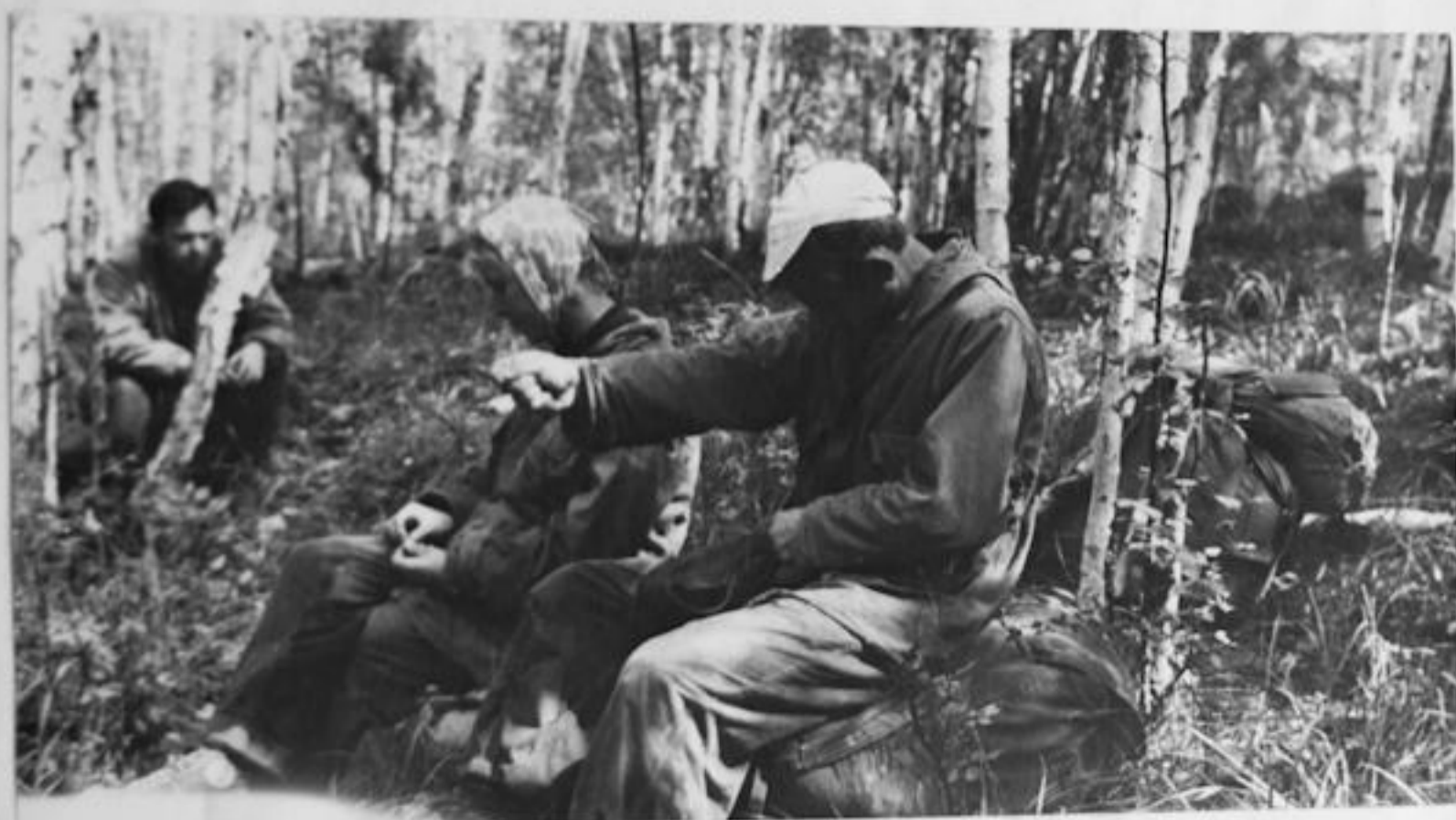
РЕМОНТ В ПУТИ

Разбор дня и задачи на следующий походный день обсуждались группой вечером у костра. При движении по маршруту применялся метод дежурного руководства. Хрометраж вели все члены группы поочередно. Вечером у костра хронометражист оповещал группу о количестве ходовых часов, времени отдыха. Дежурство по приготовлению пищи было двухдневным по двое. Руководитель был освобожден от дежурства. Завтрак и ужин готовились горячими. Обед в основном был сухим. Иногда на обед готовилась манная каша и чай, или только чай. В ситуациях сложного ориентирования группа разбивалась по двое и выходила на разведку. Более 1,5 часа разведки не практиковались. Так же вечерами практиковались часовые разведки-выходы с целью реконсцировки линии движения на следующий день.